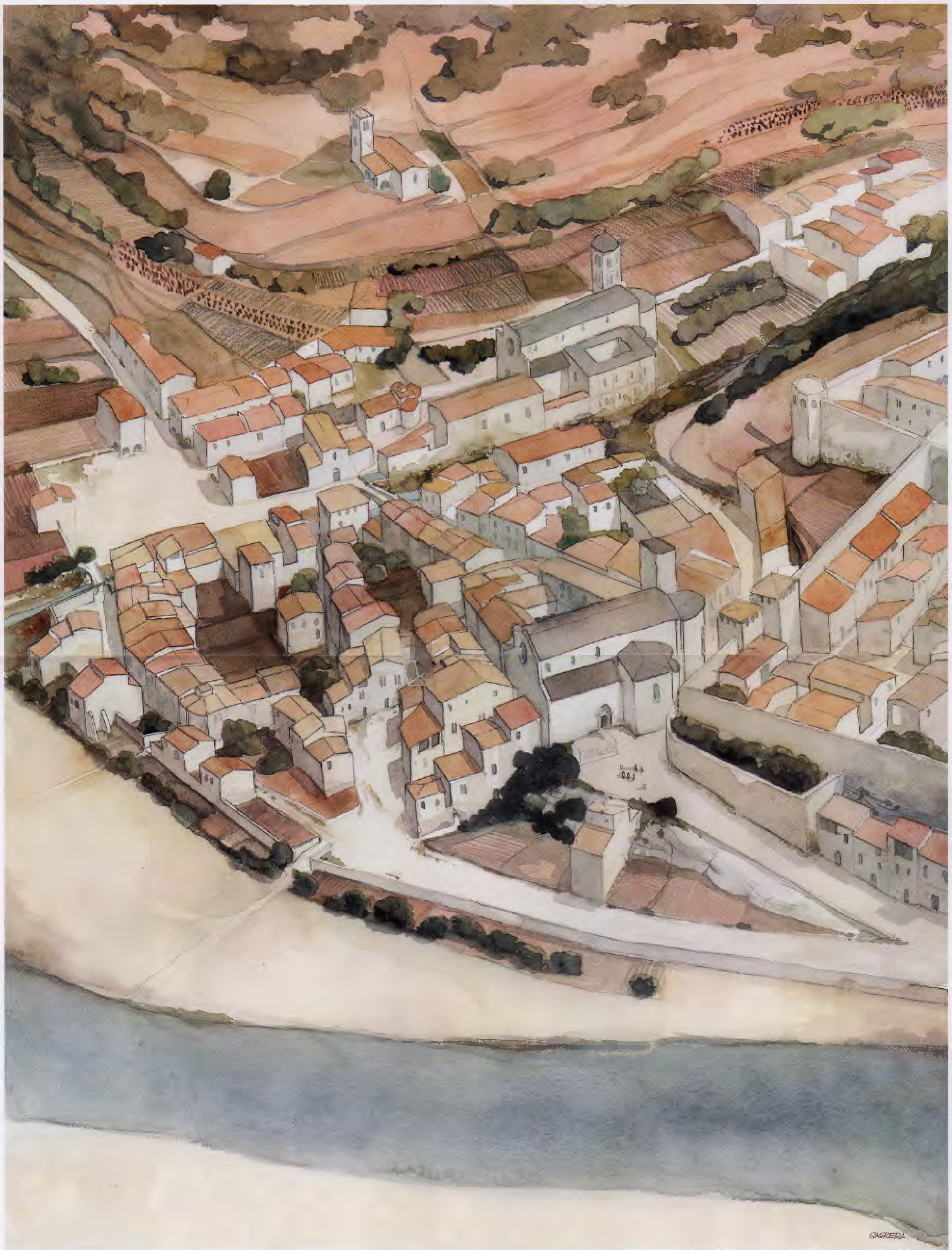
EL SECTOR NORD DE LA CIUTAT DE GIRONA - BURGS DE SANT FELIU, SANT PERE DE GALLIGANTS I SANTA EULÀLIA SACOSTA, A MITJAN SEGLE XIII