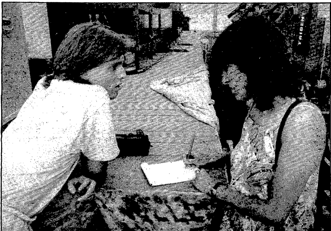
Miguel Bosé arribà al camp del Girona a primera hora de la tarda