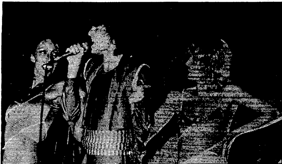
El Cinquantenari del Girona va començar en castellà.