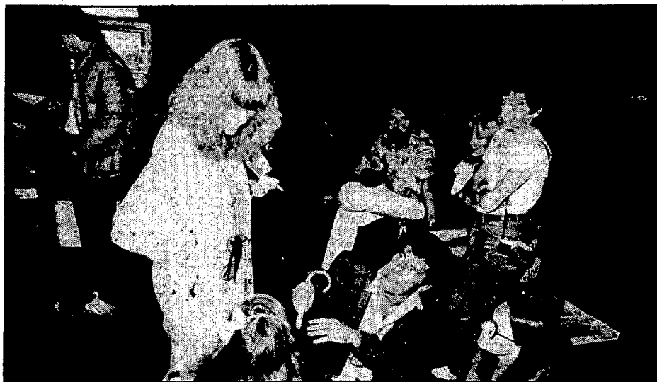
La cultureta màgica a Girona.

Hi havia força menys gent del que s'esperava