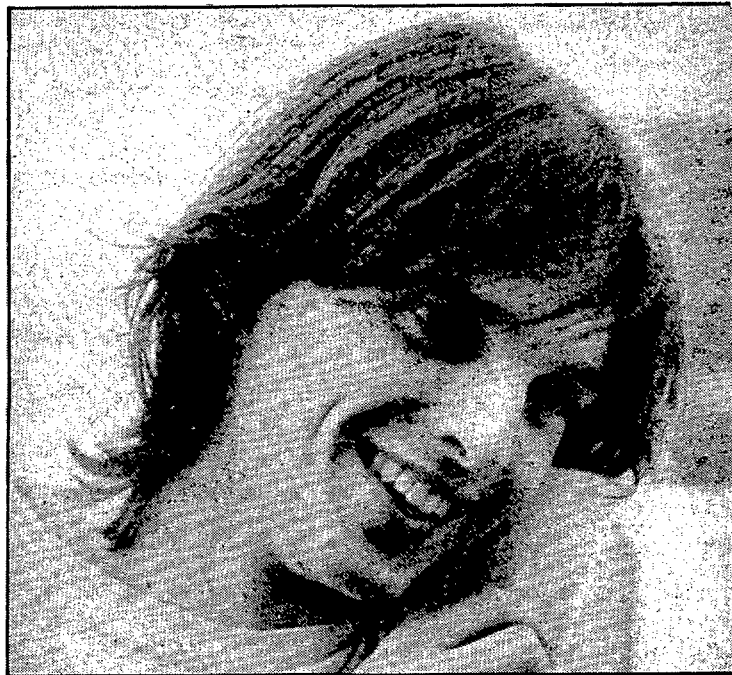
"Encara no he anat ni un sol dia a la platja"