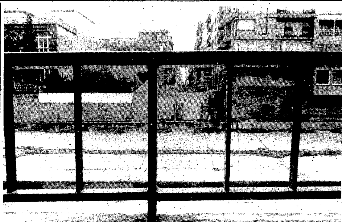
Aquí es construirà el nou viaducte

Unirà el carrer del Carme amb el Lorenzana